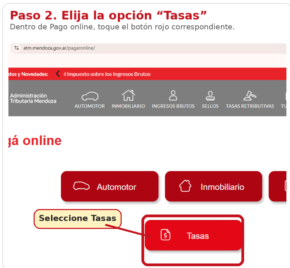
Imagen orientativa del paso.

Dentro del módulo de Pago online, seleccione la opción “Tasas” para continuar con el trámite.