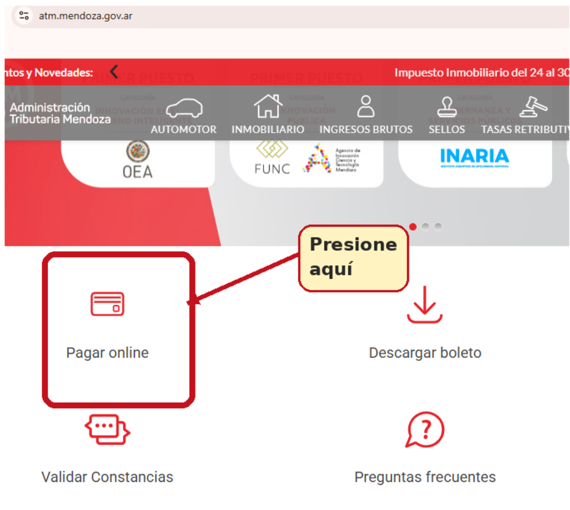
Imagen orientativa del paso.

Desde la portada, seleccione el botón "Pagar online".